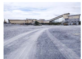
พื้นที่โรงโม่หินของโครงการ