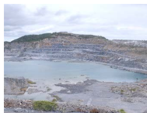
พื้นที่หน้าเหมืองของโครงการ